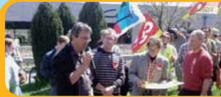
Vos luttes dans la région Ratier - Figeac (46)