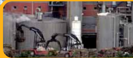
A la une Politique Industrielle