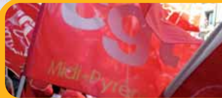
Actualité régionale Euro manifestation